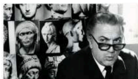
"Forma Urbis" La rassegna cinematografica ispirata alle architetture della Capitale