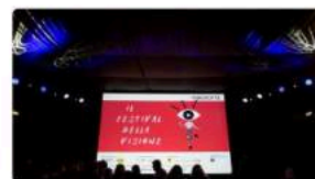
Videocittà, il Festival della Visione A Roma fino a dicembre 2019