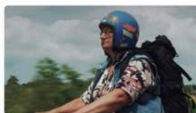
"Corto e Fieno", Festival del Cinema Rurale Un appuntamento internazionale sul lago d'Orta